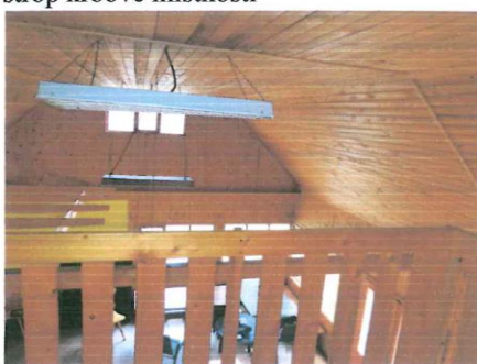
strop krbové místnosti