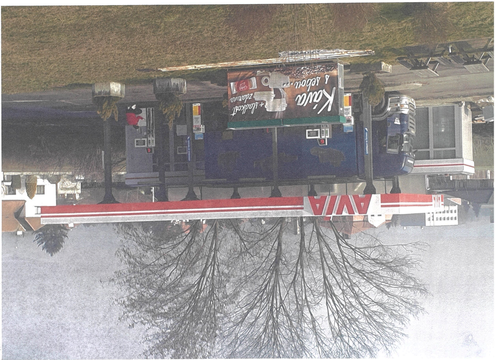
POHLED Z OKEN RODINNÉHO DOMU