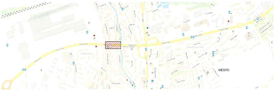
Celková situace - PDZ V MĚSTĚ HRANICE

LEGENDA: Prostor uzavírky mostu (oprava dilatací)